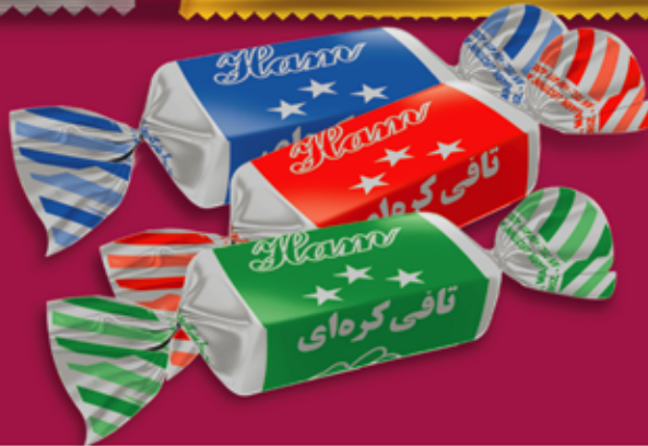
Butter Toffee تافی کره ای