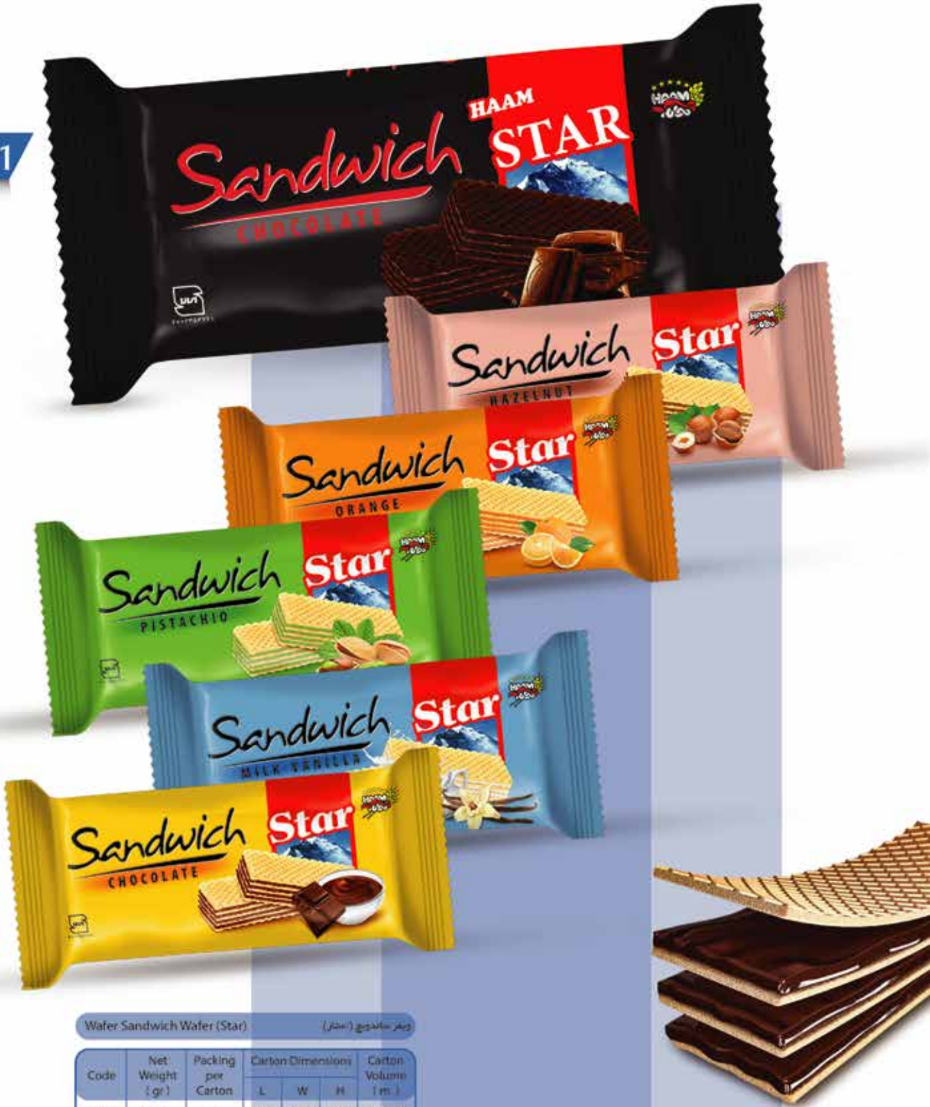
Wafer Sandwich Wafer (Star) (ویفر ساندویچ (اسٹار))