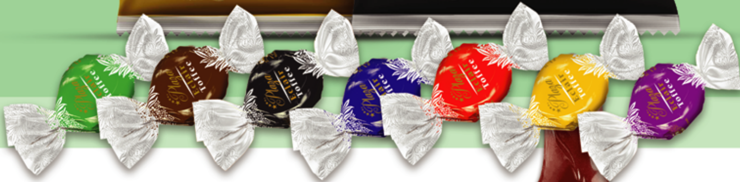
Eclair Toffee (Plaza) تافی مفردار (پلازا)