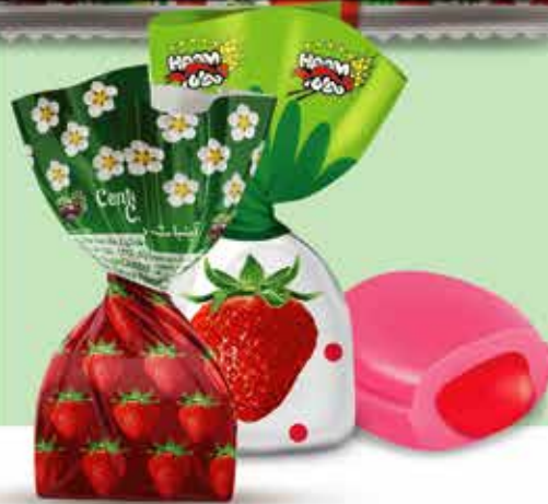
Strawberry Filled Candy