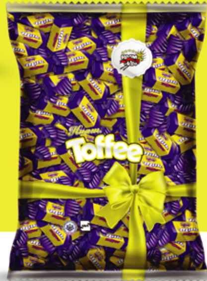
Milk Toffee تافی شیری