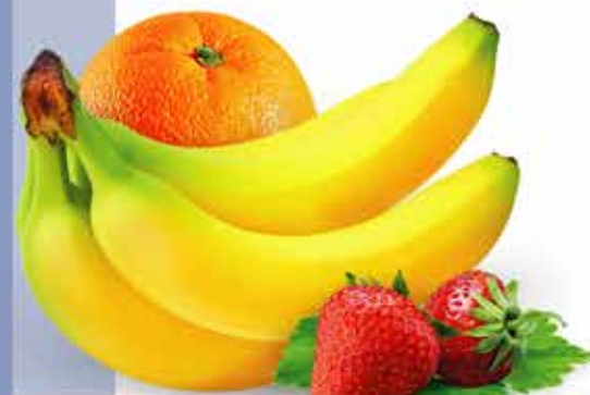
وایفر منیجی (ستار) (Mini Munge Wafer(Star))