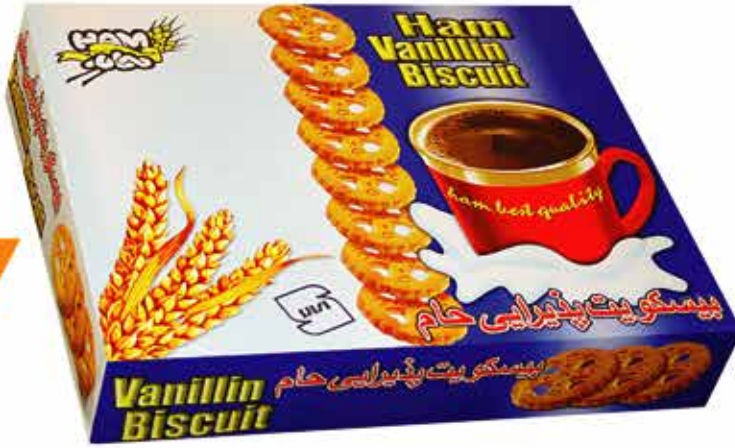
Vanilla Biscuit (Haam) (بیسکویت وانیلی جعبہ پذیرایی (حام))