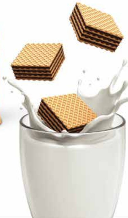
Wafer (FORTUNE) (ویفر نغمه ای (فورچن))