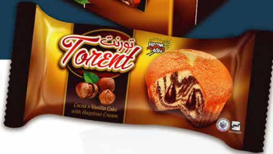
Cup Cake (Torent) (ٹاپ ٹیک ڈورنگ دو قانو (ٹورنٹ))