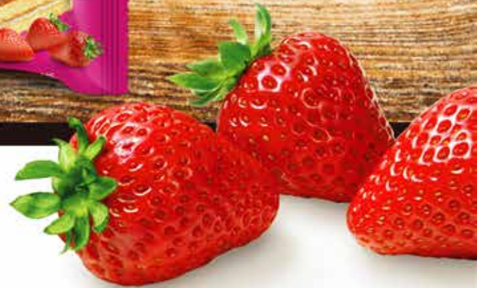
Layer Cake (Pluto) کیک تہہ ای کرمدار (پلاٹو)