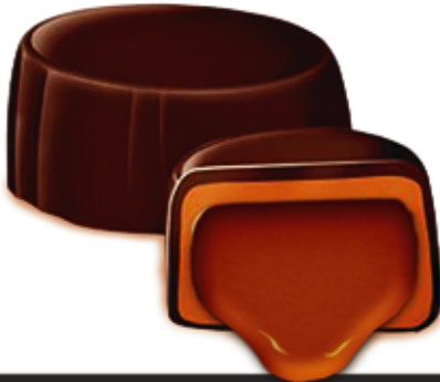
Chocolate Coated Eclair Toffee (Galaxy Haam)