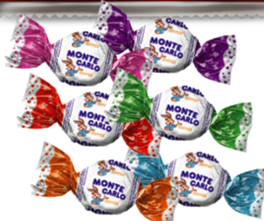
Eclair Toffee (Monte Carlo) ٹافی معزدار (مونٹ کارلو)