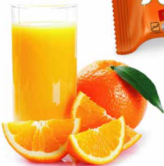
Wafer (Rozet) (ویفر (روزت))