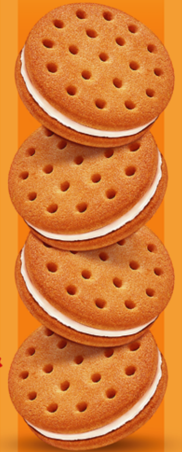
بیسکویت میوہدار کرمدار (HAAM) Sweetmeal Cream Biscuit