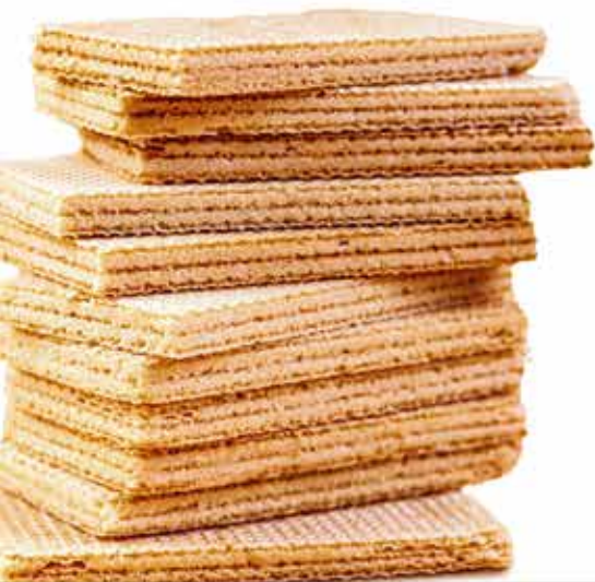
Mange Wafer (FORTUNE) منجے واٹر (فورٹون)