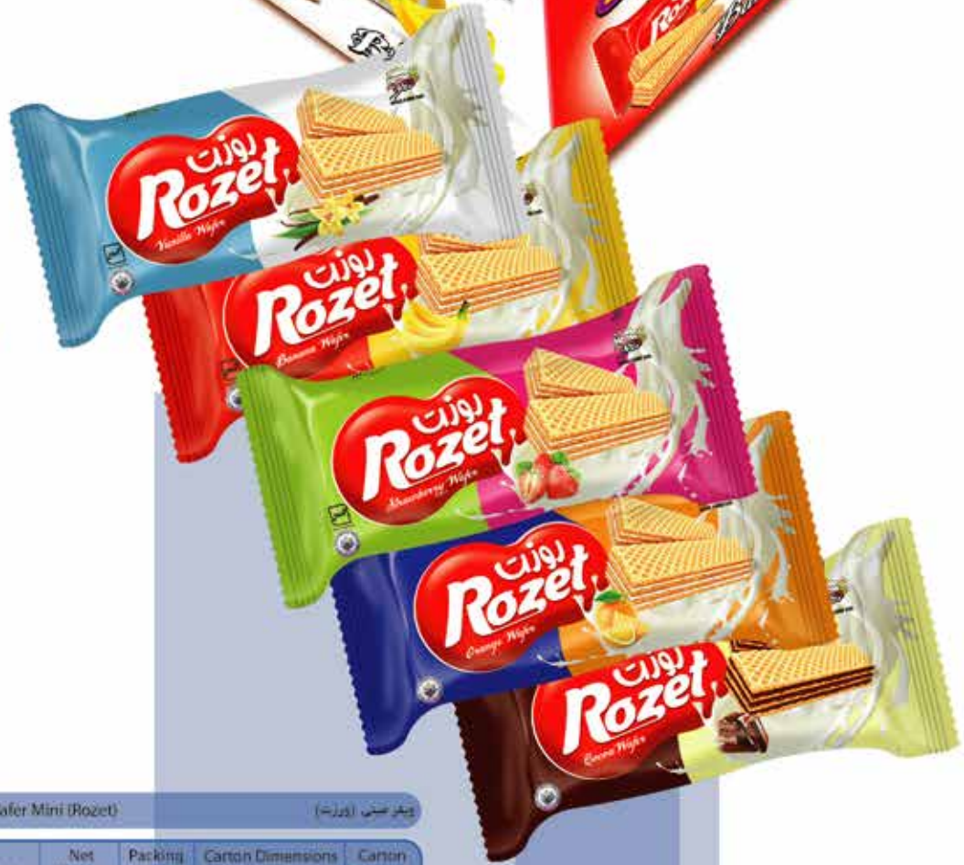
Wafer Mini (Rozet) (بیگز مینی (روزت))