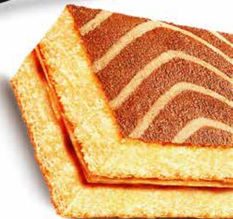
کیک لایہ ای (ٹوکا) Layer Cake (Tooka)