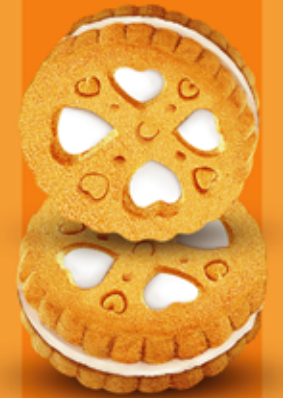
بیسکویت کرمدار استوانه (حام) Sandwich Cream Biscuit (HAAM)