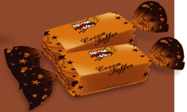
Cocoa Toffee تافی کاکائویی