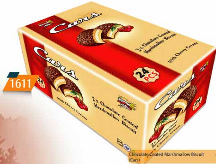
Chocolate Coated Marshmallow Biscuit (Cars) والس شڪلاي (كارز)