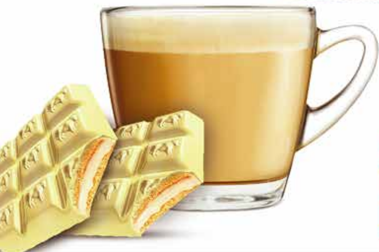
Milky Marshmallow Biscuit (Hella) (وائس شیری (هلا))