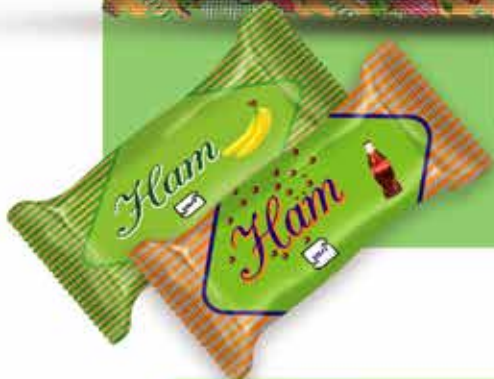
Mini Warpped Candy آبیات معزدار مینی راب