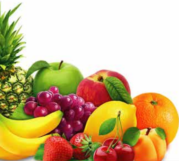
Sour Toffee تافلر ترش میوه ای