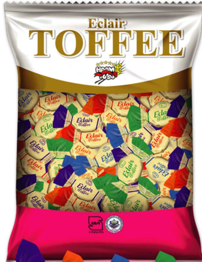
Eclair Toffee (Avril)