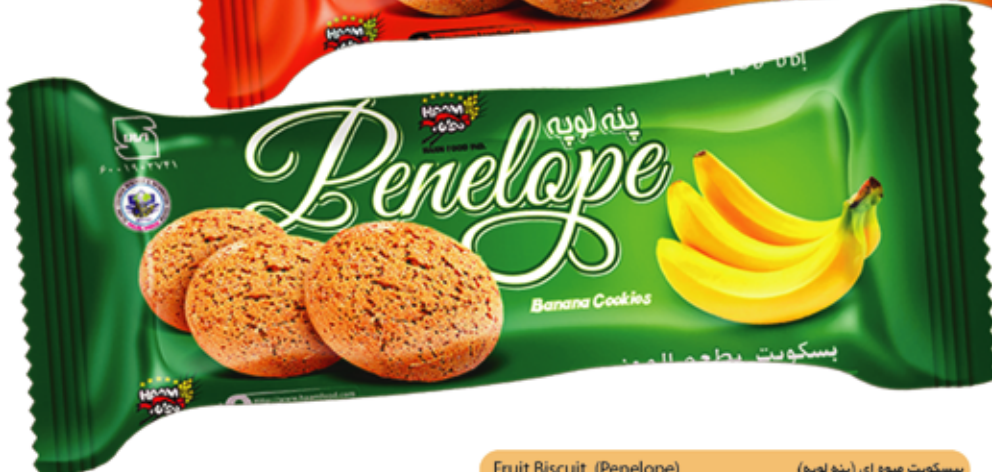
Fruit Biscuit (Penelope) بیسکویت میوه ای (پنه لویه)