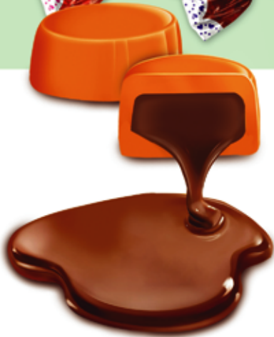
Eclair Toffee (Tooka)