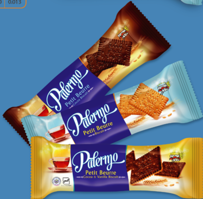
Petit Beurre Biscuit (Palermo) بیسکویت پتی بور (پالرمو)