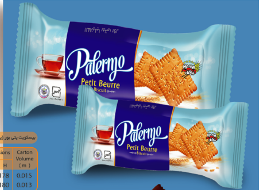
Petit Beurre Biscuit (Palermo) بیسکویت پتی بور (پالرمو)