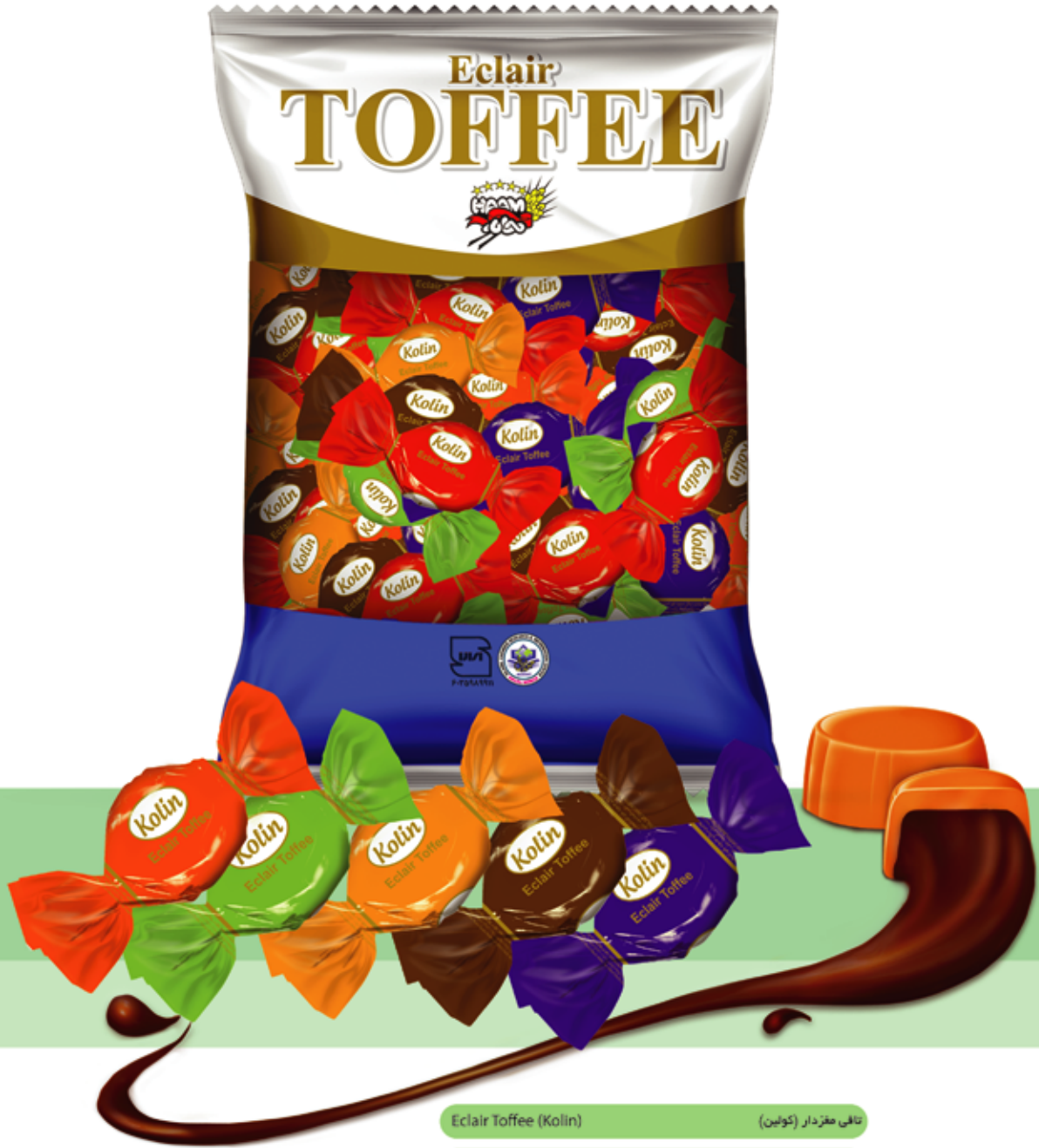
Eclair Toffee (Kolin) تافی معزدار (کولین)