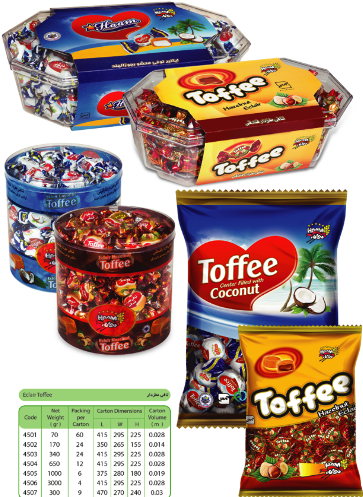
Eclair Toffee تافی مغزدار