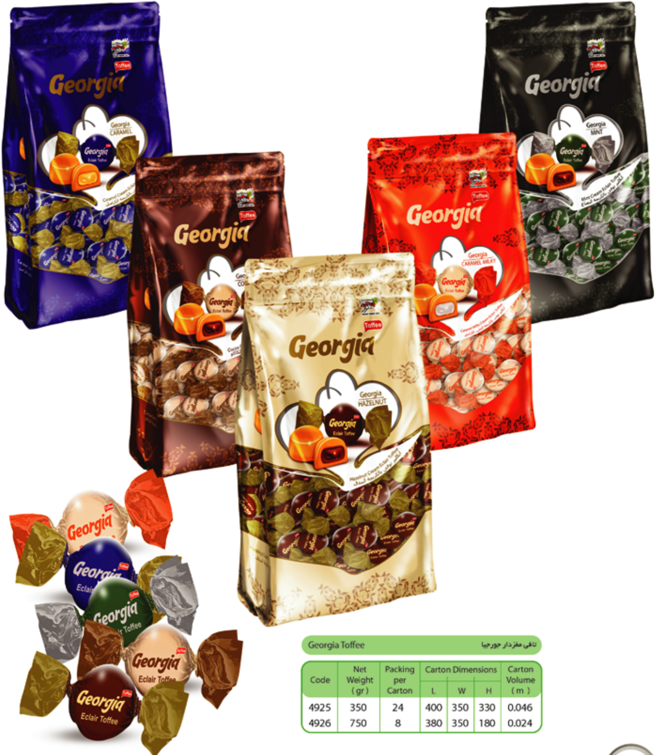
Georgia Toffee تافی مغزدار جورجیا