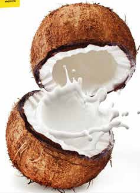
Wafer (Plaza) وٹیر (پلازا)