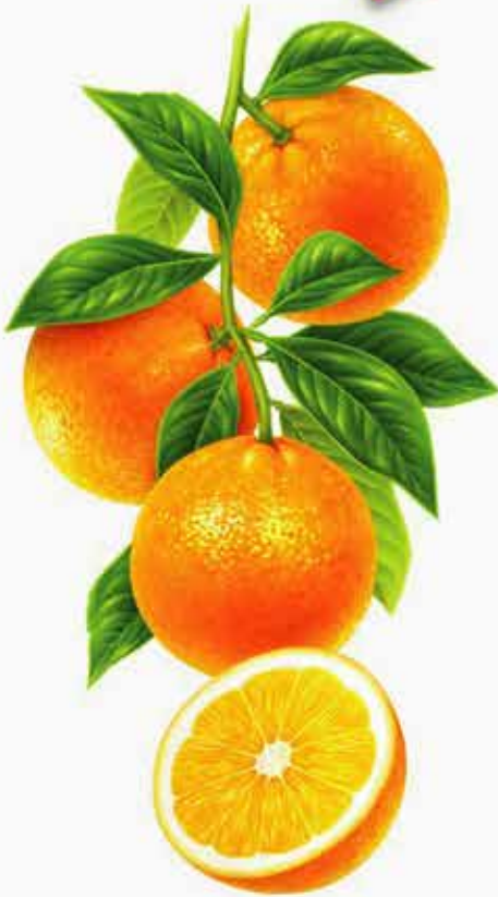
Wafer (Setare) (ویفر سوزر پدیراین (ستاره))