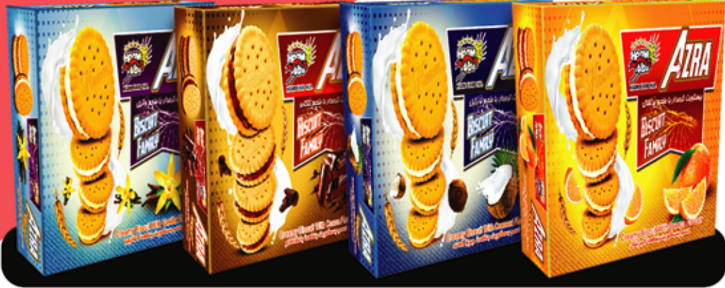
Petit Burre Bisscuit (AZRA) بیسکویت جعبہ پذیرایی پتی بور (آزرا)