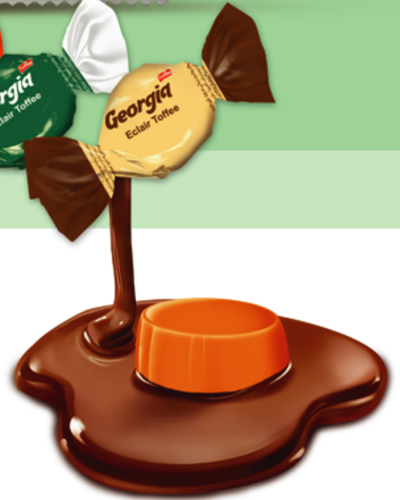
Eclair Toffee (Georgia) تافی مفردار (جورجیا)