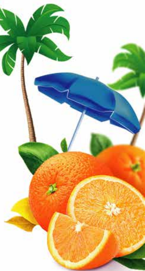
Wafer (Pluto) (بجر (پلوٹو))