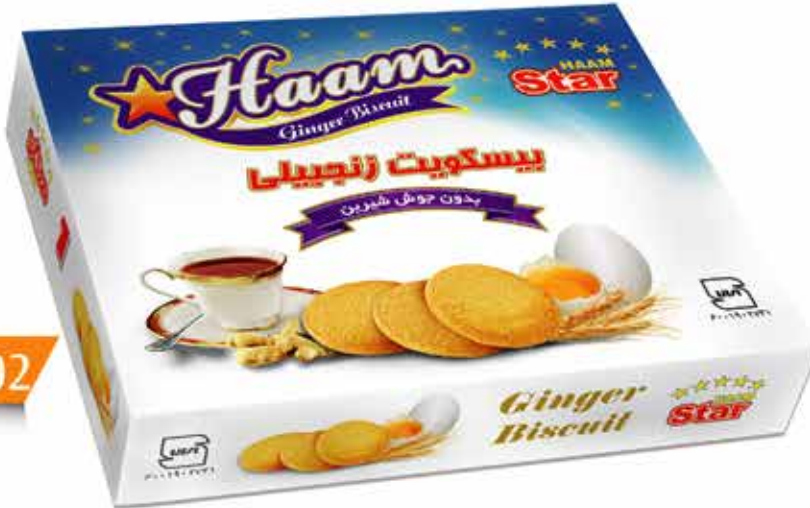
Ginger Biscuit (Haam) (بیسکویت زنجبیلی جعبہ پذیرایی (حام))